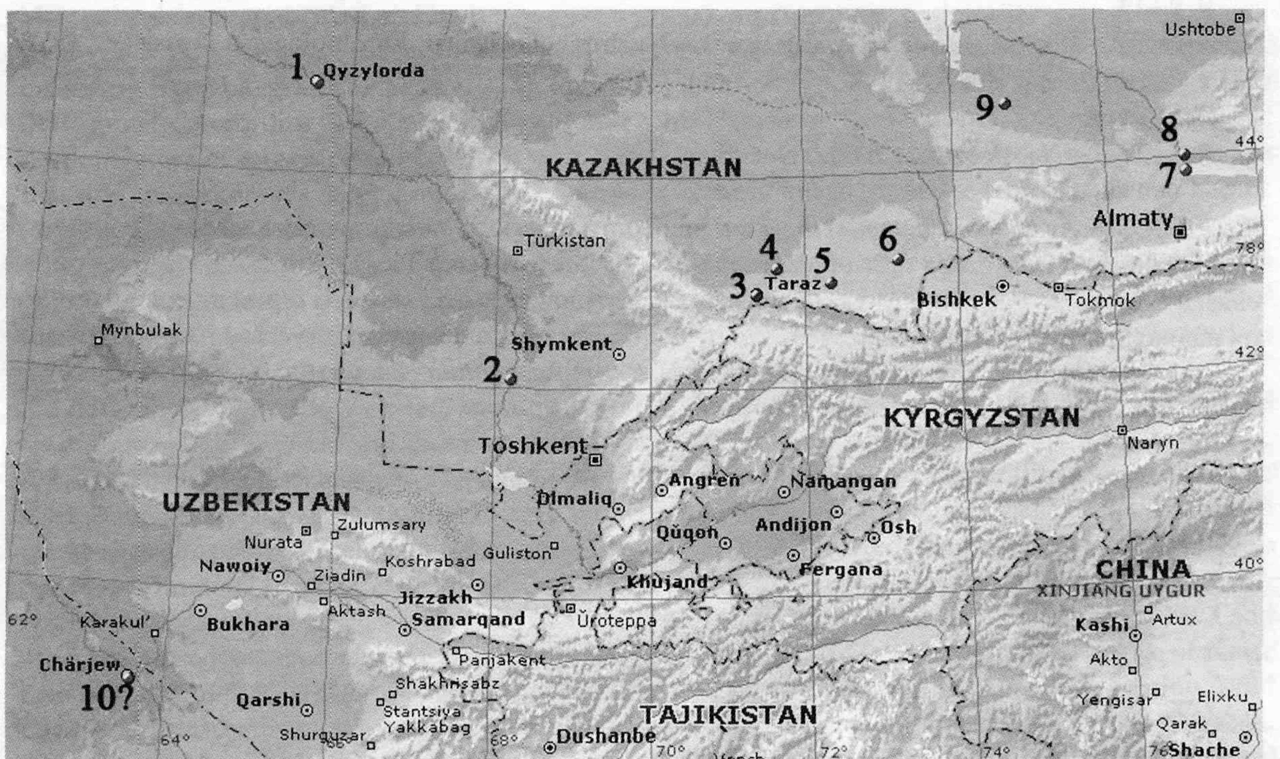
Рис. 4. Карта распространения Agaranthia auliensis Pic.

1 — Сенек, N 43° 21' 38.0'' E 053° 27' 17.7'' (типовой локалитет); 2 — пески Сенгиркум, N 43° 44' 53'' E 053° 38' 14''; 3? — п-ов Куланды [Кадырбеков, Тлеппаева, 2004 (как « Agaranthia bucharica »)]